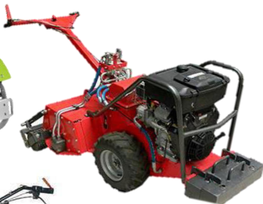
8016 vollhydraulische Bodenfräse