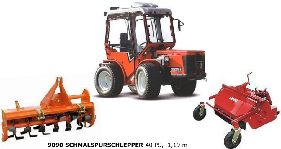
9090 SCHMALSPURSCHLEPPER 40 PS, 1,19 m

mit Fräse 1,3m Umkehrfräse 1m Mähwerk 1,5m