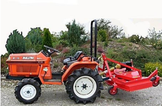
8002 KLEINSCHLEPPER Diesel 15PS, Breite 1100mm

mit Fräse 1300mm Breite oder mit Mähwerk 1000mm Breite pro Tag 105,-- € (124,95 €)